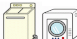
洗濯機・衣類乾燥機