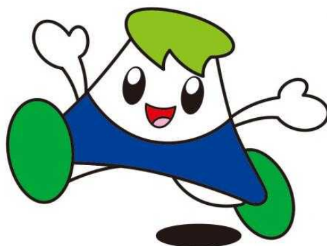
国民文化祭やまなし大会のキャラクター「カルチャくん」