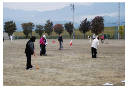
市川大門総合グラウンドでグラウンドゴルフを楽しむ町民