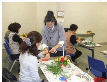
レディース講座(フラワーアレンジメント)