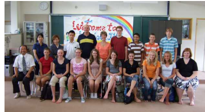
マスカティーン市訪問団(市川中学校にて)