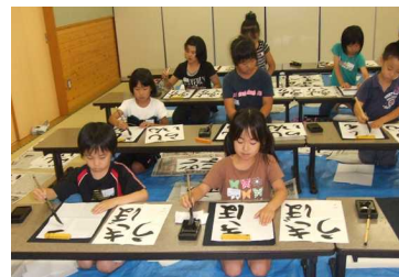
たのしい教室(書道)