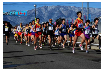
第61回大会のスタート地点