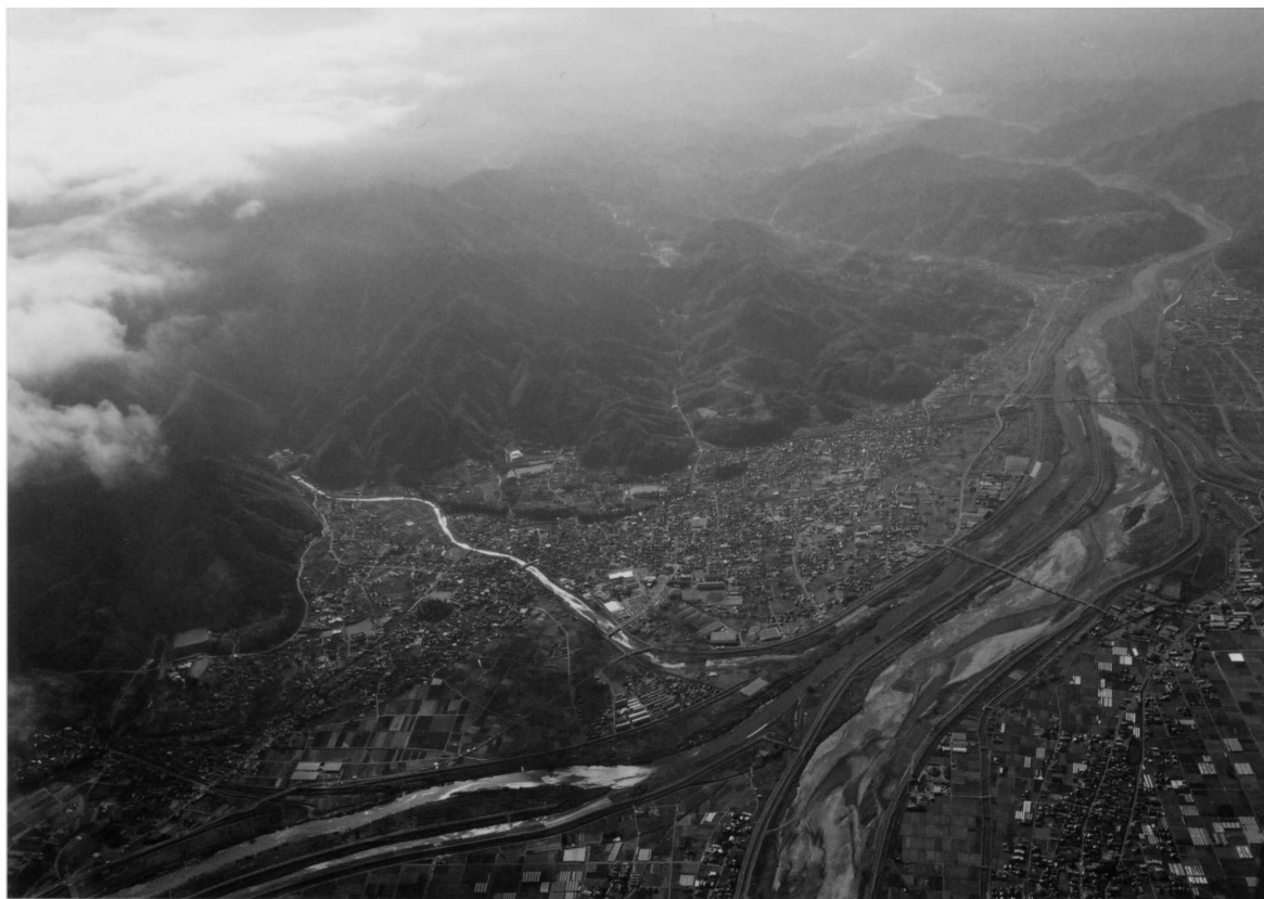
上空から見た市川三郷町の景観