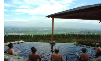
みたまの湯露天風呂