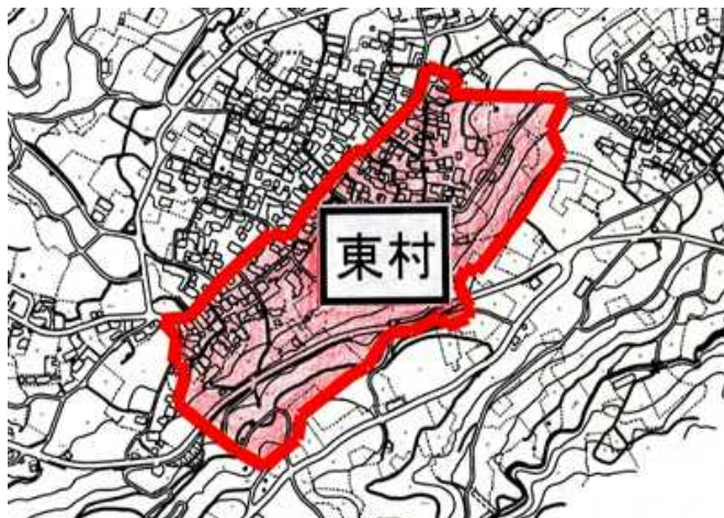
<平成23年度地籍調査実施区域図>