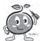
2010年世界農林業センサスマスコットキャラクター

調査票に記入された事項については、統計以外の目的には使用されませんので、ご協力をお願いします。