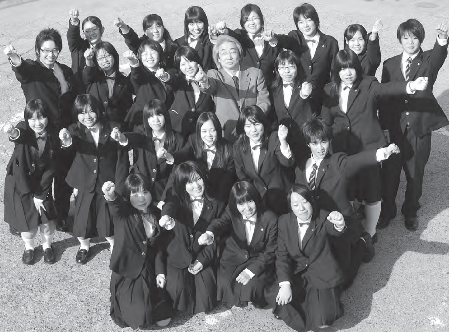
市川高校音楽部 全日本合唱コンクール銀賞受賞 (詳細記事 5 ページ)

□市川三郷町役場(本庁舎) 〒409-3601: 山梨県西八代郡市川三郷町市川大門 1790-3 ☎ 055(272)1101 (代表) FAX055(272)2525 □六郷庁舎 〒409-3244: 山梨県西八代郡市川三郷町岩間 495 ☎ 0556(32)2111: FAX0556(32)2887