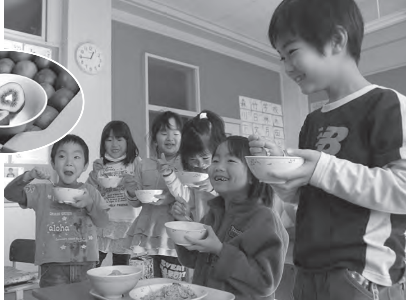
▲大塚小1年生の給食にて。杏仁豆腐に入っているレインボーレッドを口にほおばると児童たちは一様に「ンマ〜イ♡」

レインボーレッドとはキウイフルーツの新品種で、一般的な「ヘイワード」という品種に比べやや小さく、うぶ毛がなく中心が赤いのが特徴です。ＪＡ西八代キウイ部会では、産地である三珠地区の子どもたちに栄養も豊富なこのレインボーレッドを食べてほしいと、三珠給食センターに100個を寄付しました。寄付されたレインボーレッドはさっそく杏仁豆腐の具として調理され、三珠管内の小中学校へ約400食が配られました。