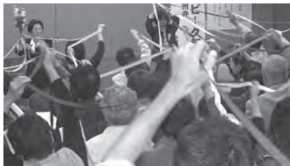
▲参加者全員がひとつになれたフィナーレ