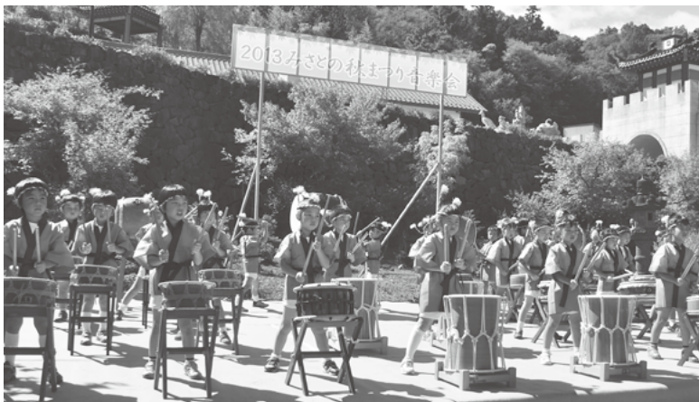
▲市川大門管内保育所の合同による太鼓演奏