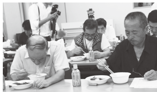
▼試食する町内の飲食店主

今後は販売店を募り、スープ、具材などを各店で吟味してもらいオリジナル市川三郷ら～めんとして売り出してもらいたいとのこと。青年部ではご当地市川三郷ら～めんを広く売り出して、市川三郷町の活性化につなげたい考えです。