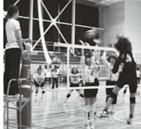
▲相手チームのエースをブロックするみたまチーム

Aパート B-T.O.P (南アルプス市) Bパート 大 国 (甲府市) Cパート とまと (中央市)