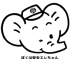
ぼくは安全エレちゃん