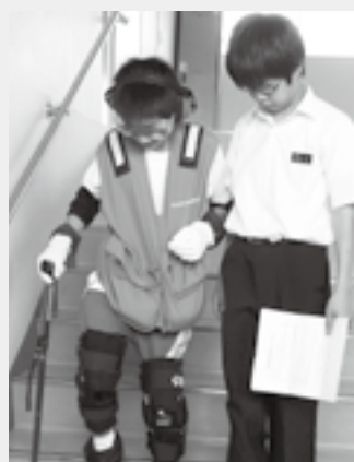
◀高齢者疑似体験の様子

今後、授業のなかで福祉体験を取り入れたいと考えている学校や地域がありましたら、お気軽にご相談下さい。