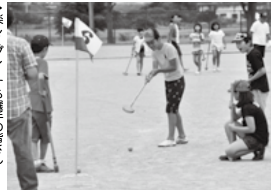
▶楽しくプレーする選手たちの皆さん