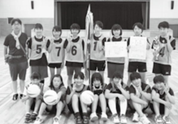
▲優勝した町屋子どもクラブの皆さん

第44回県子どもクラブ親睦球技大会(県子どもクラブ指導者連絡協議会主催)が県下6市町の子どもクラブから15チームが参加して行われ、町屋子どもクラブがミニソフトバレーボールの部で見事に優勝を飾りました。大会では、準決勝