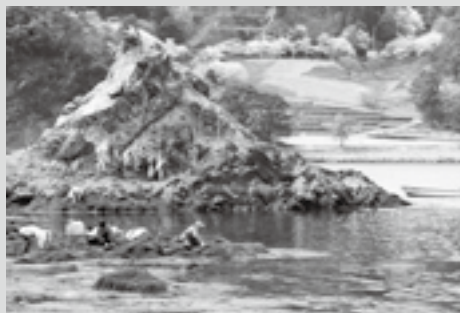
昨年度ふるさと部門グランプリ 「春漁にいそむ」

入賞者には賞金や記念品などを贈呈しているほか、入賞作品は、町民カレンダーや観光PRポスターなどに使用しています。また、黄金崎クリスタルパークなどで展示し、皆さんにご覧いただいています。「西伊豆町を切り取った」作品を、ぜひご応募下さい。