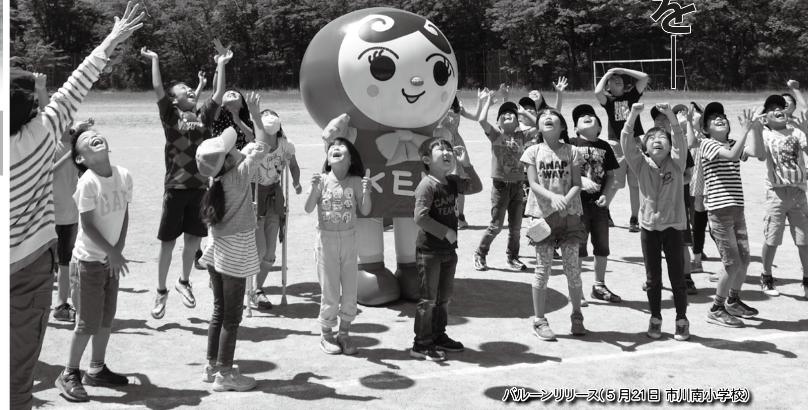
バルーンリリース(5月21日 市川南小学校)

いじめや体罰による自殺、養育放棄や虐待、児童殺害など子どもが被害者となる痛ましい事案が後を絶ちません。 子どもも一人の人間として最大限に尊重され、守られなければならないません。 法務省の人権擁護機関では、21世紀の社会を担う子どもたちの人権を守るため「子どもの人権を守ろう」を啓発活動の強調事項の一つとして掲げて、積極的に様々な啓発活動を行うとともに、人権相談や調査救済活動に取り組んでいます。 峡南人権擁護委員協議会では、毎年峡南地区の学校を訪れ「人権の花贈呈式」を行っています。これは、子どもたちに花を贈り、育てることで思いやりや命の大切さを理解してもらうことが目的です。 今年、市川南小学校と六郷小学校において行われ、贈呈式の最後に、花の種とメッセージを付けた風船を飛ばすと、子どもたちの想いのこもった風船は大空高く飛んでいきました。(表紙・写真)