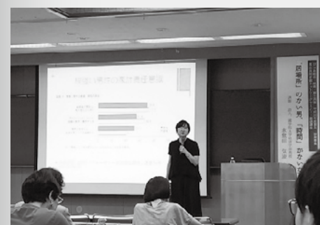
▲5月26日に開催された、男女共同ネットワークセミナー基礎講座の様子

現在は、イクメン制度や育児休暇制度など子育てがしやすい環境になっているので、今後の若い世代に期待している。