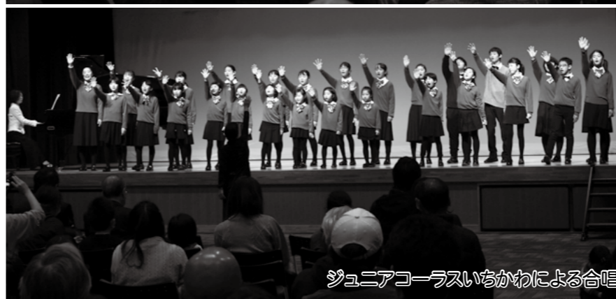
ジュニアコーラスいちかわによる合唱