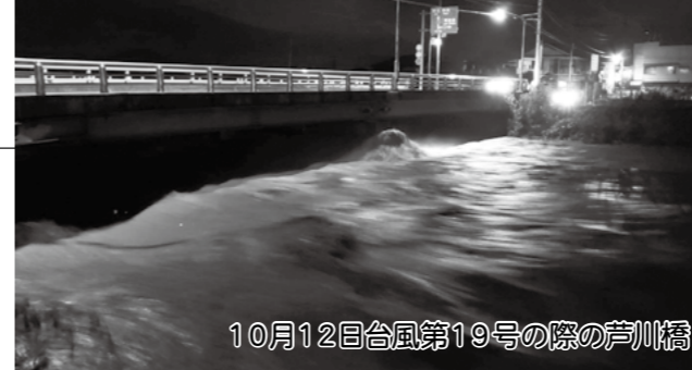
10月12日台風第19号の際の芦川橋

ご不明な点がございましたら消防本部までお問い合わせ下さい。 峡南消防本部 ☎055-272-1919 (代表)