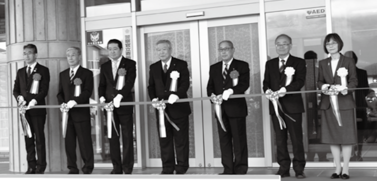
オープニングセレモニー テープカット