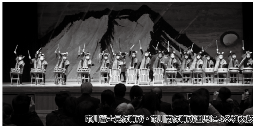
市川富士見保育所・市川南保育所園児による和太鼓