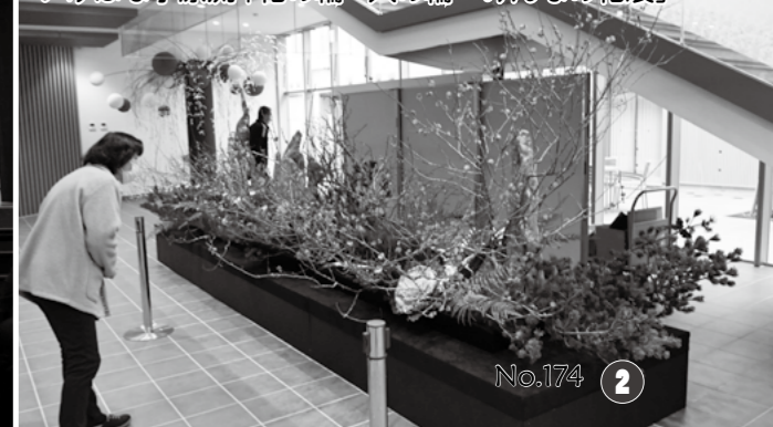
いけばな小原流「花の輪・人の輪 みんなの花展」