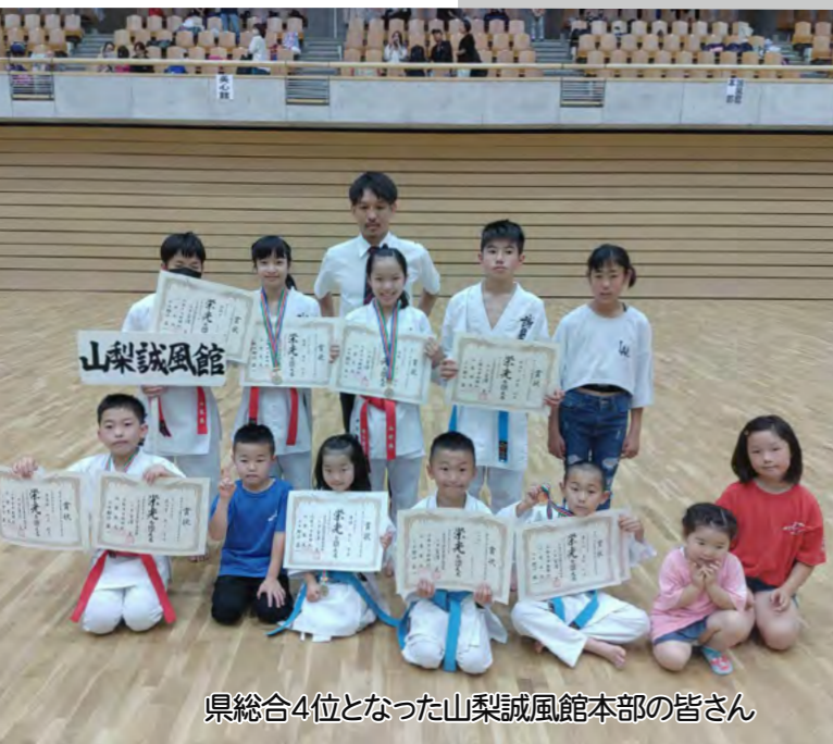
県総合4位となった山梨誠風館本部の皆さん

大塚小大塚にんじん種まき体験 6/16 町農林課は、地元特産物を知ってもらおうと、みたまの湯となりの畑で大塚小児童らと一緒に大塚にんじんの種まきをしました。 12月には成長した大塚にんじんを収穫する予定です。