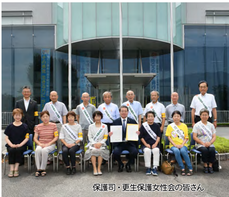
保護司・更生保護女性会の皆さん