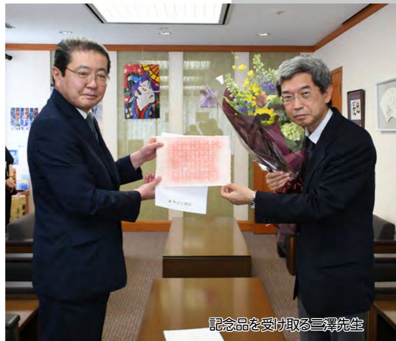
記念品を受け取る三澤先生