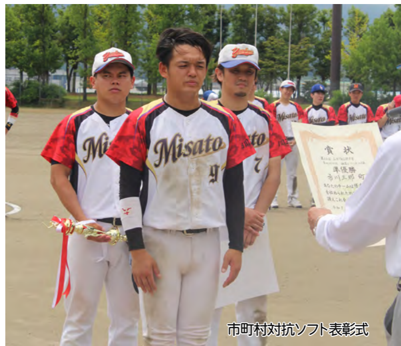
市町村対抗ソフト表彰式