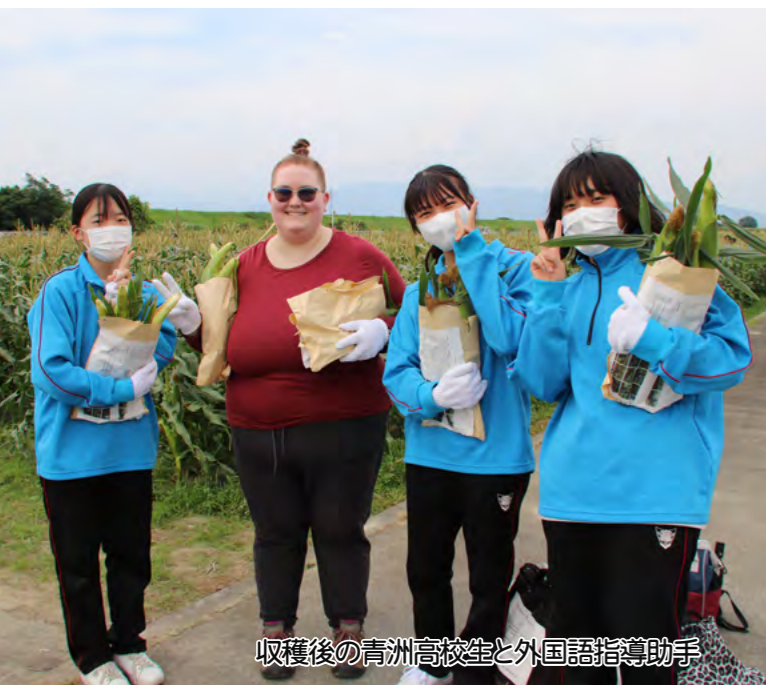
収穫後の青洲高校生と外国語指導助手