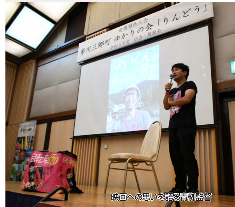
映画への思いを語る青柳監督

お知らせ イベント内容などをより分かりやすくお伝えするため、今月号よりレイアウトを変更しました。