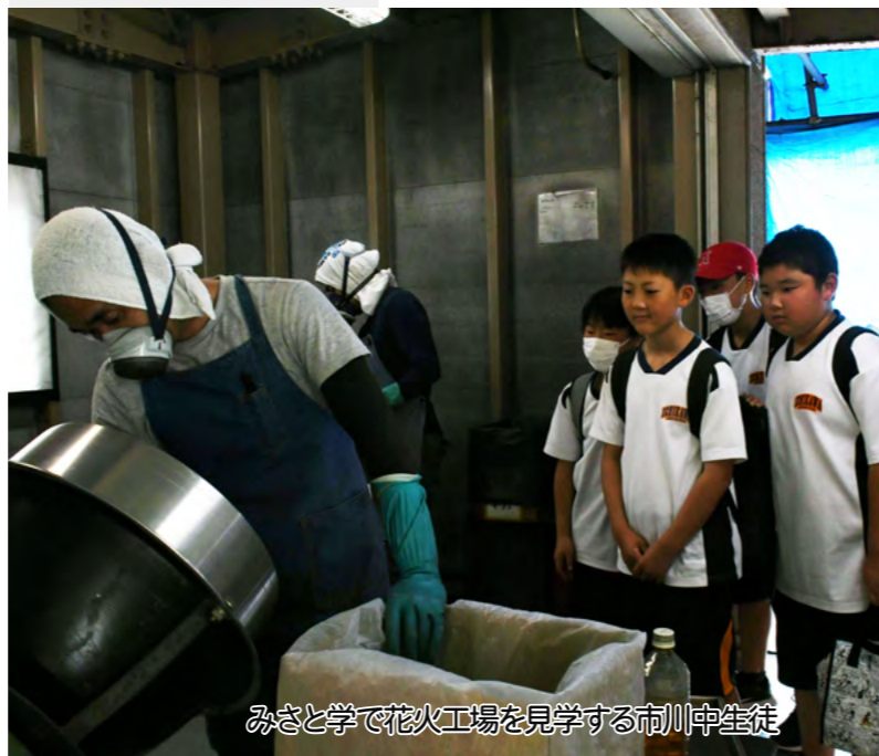
みさと学で花火工場を見学する市川中生徒