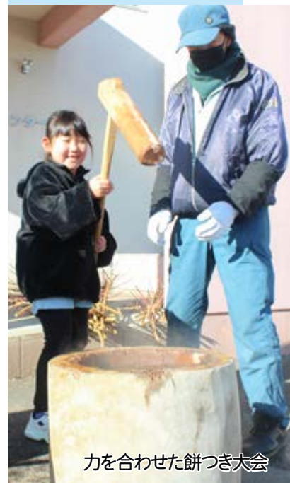
力を合わせた餅つき大会