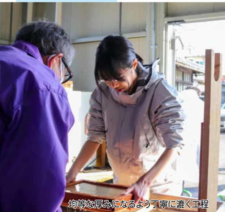
均等な厚みになるよう丁寧に漉く工程

市川富士見保育所 節分行事 2/3 町内各保育所で節分行事が行われました。市川富士見保育所では、鬼が現れると園児たちが大きな声で「鬼はーそと」「福はーうち」と力強く豆をまきました。鬼の迫力に泣いてしまう子もいましたが、みんなで協力して最後には無事に鬼を退治することができました。