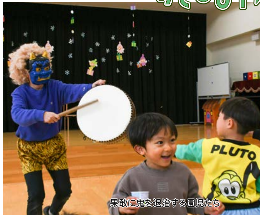
果敢に鬼を退治する園児たち

市川小 手漉き和紙の卒業証書づくり 1/24 市川小では、6年生の卒業証書として伝統産業である手漉き和紙の卒業証書を制作しました。市川和紙技術研究会による指導のもと、一人ひとりが真剣な表情で想いを込めて取り組みました。完成した卒業証書は、それぞれ名前を入れ卒業式で手渡されます。