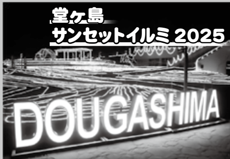
▲イルミネーションの様子

約10万球の灯がともる伊豆・西海岸最大のイルミネーションがはじまります。2019年から始まったイルミネーションは今年で7回目の開催です。幻想的な光が夜の堂ヶ島公園を照らし、訪れる人々を楽しませます。