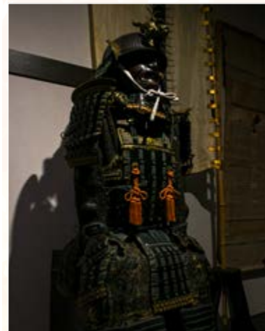
じきさんはもと 直参旗本 おきつけでんらいもがみどうぐそく 興津家伝来最上胴具足

2階の展示室には、現在の歌舞伎文化公園の一角に館を構えたといわれる一条信龍ゆかりの品をはじめ、数多くの兜・鎧、歴史的文献、資料などを展示。 特に兜・鎧は実際に使用されていたものであり、兵者達の魂を感じることができ、かも知れません。