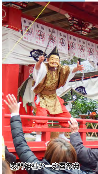
表門神社の一之西祭典

各地で伝統のお祭り賑わう 2/2 毎年立春の時期に行われるお祭りが今年も各地で開催されました。黒沢地区の妙学寺では、厄よけを祈願する星祭りを開催。豆まきなども行われました。また、上野地区の表門神社・之西祭典では、表門神社神楽保存会により岩戸神楽が奉納され、和やかな春の訪れを感じさせました。 町内保育所 交通安全教室 2/27 黒沢警察署と町は、4月から新1年生となる町内保育所の年長児を対象に、交通安全教室を実施しました。園児らは、おまわりさんから危険な場所や交通ルールを教わりながら、道路の渡り方などを練習しました。安全に楽しく小学校生活を送ってくださいね。