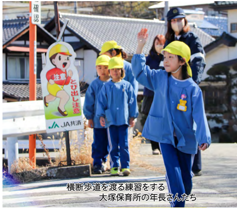
横断歩道を渡る練習をする 大塚保育所の年長さんたち

令和7年度 固定資産税の縦覧 自身の所有物件以外にも町内の土地や家屋の価格を確認でき、価格を比較できる制度です。縦覧できる方は、固定資産税の納税義務者本人、または代理人です。 【期間】4月1日(火)〜30日(水)の平日(午前8時30分〜午後5時15分) 【場所】町役場本庁舎税務課、六郷出張所 【持ち物】本人確認ができる書類(運転免許証など)。※代理人の場合は委任状が必要です。 町税務課資産係 ☎055(272)1104