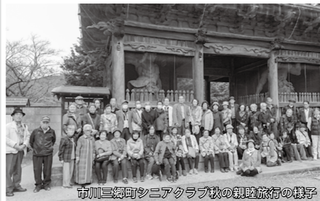
市川三郷町シニアクラブ秋の親睦旅行の様子

シニアクラブに 加入しませんか? 市川三郷町シニアクラブは、会員相互の親睦を図り、明るく家庭住みやすい地域づくりを目指し、老人福祉増進に寄与することを目的として活動を行っています。対象は60歳以上の方で、地区活動やグラウンドゴルフ・ゲートボール・輪投げなどのスポーツ活動、書道・絵画などの文化活動、会員の親睦旅行など、すでに活動している団体とのマッチングや、新たに活動を模索されている方へのご相談も受け付けています。シニアクラブに加入して地域の仲間と楽しく活動しませんか? 入会希望の方は、シニアクラブ事務局(社会福祉協議会)へお気軽にご相談ください。