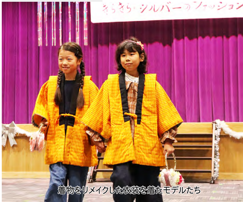
着物をリメイクした衣装を着たモデルたち