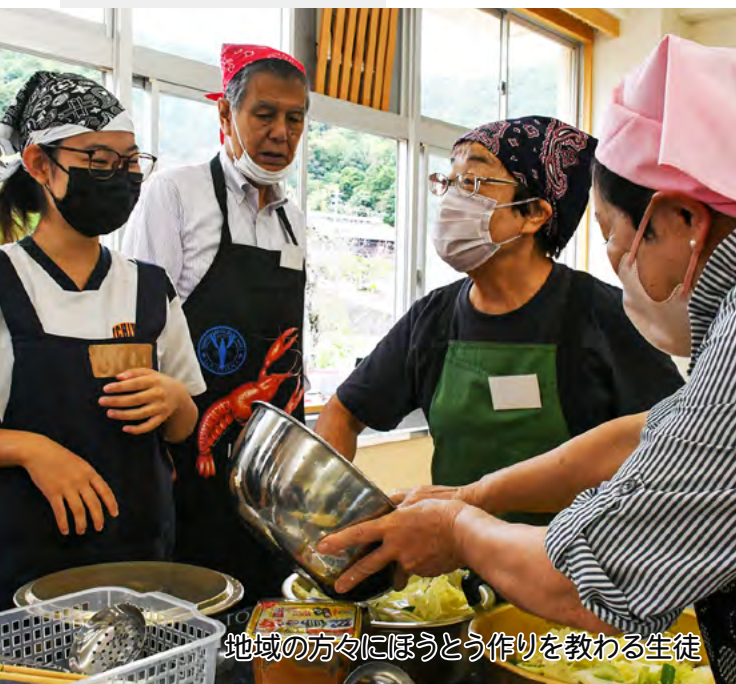
地域の方々にほうとう作りを教わる生徒

秋晴れの町を練り歩く 秋晴れの文化の日、高田地区にある一宮浅間神社では秋の例大祭が行われました。地域活性化を目的とした神輿渡御には約100人が参加し、同神社から出発すると、地域の安全や幸福を願いながら、威勢よく高田地区内を練り歩きました。