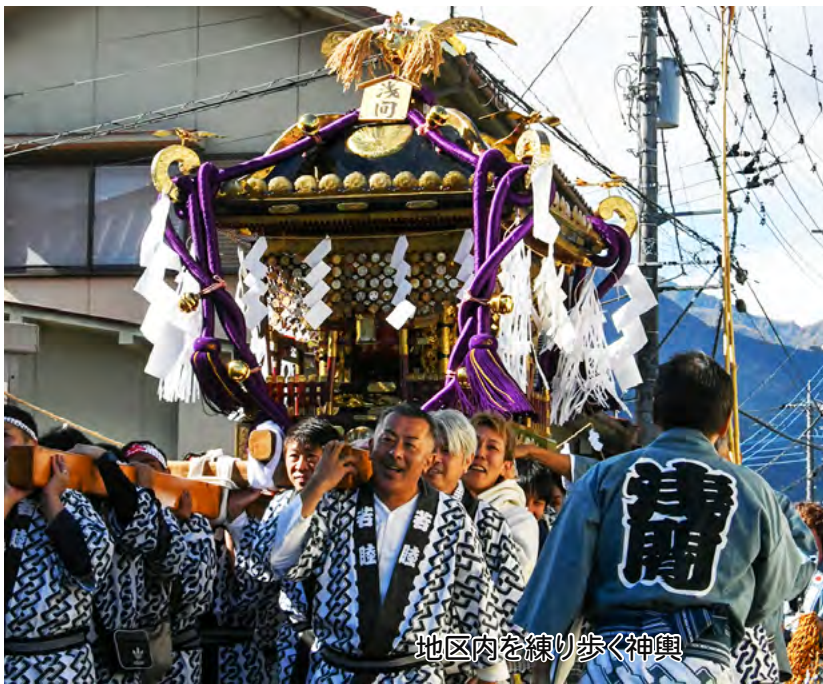
地区内を練り歩く神輿

毎年恒例！「ほうとうべん」の会 市川中2年生37人と地域の方18人が参加し、「ほうとうづくり」の会が行われました。この会は、「学校・地域・家庭連携推進協議会」主催の恒例行事で、生徒たちは地域の方々に教わりながら麺を打つところから手作りをし、最後は全員でほうとうを味わいました。