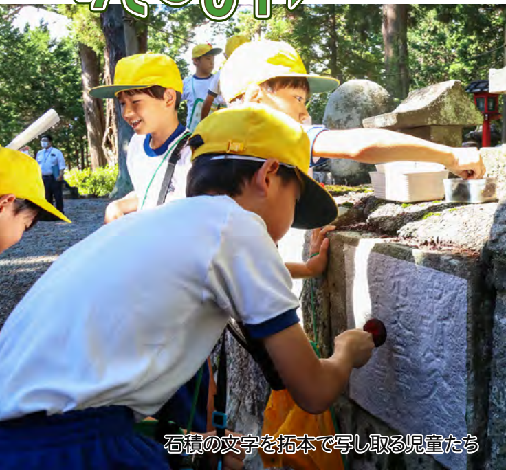
石積の文字を拓本で写し取る児童たち