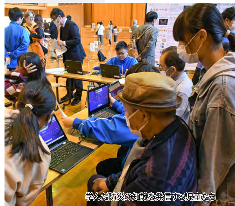
学んだ防災の知識を発信する児童たち