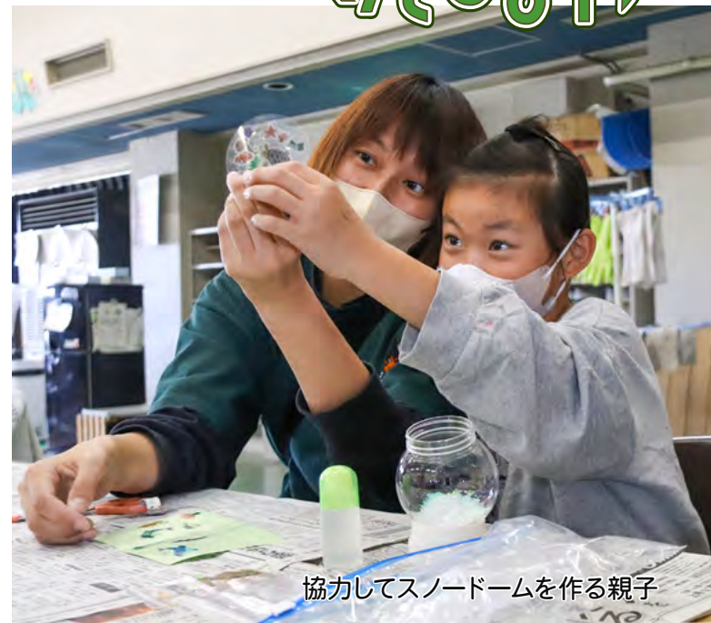
協力してスノードームを作る親子

タスキをつないで健脚競う 11/27 第48回市川三郷町六郷地区一周駅伝競走大会が開催され、地元の地区や愛好会をはじめとした約100名が出場しました。大会は合併前から続いており、今回で48回目を迎えます。選手たちは大勢の観客たちの声援を受けながら、さわやかな汗を流しタスキをつなぎました。