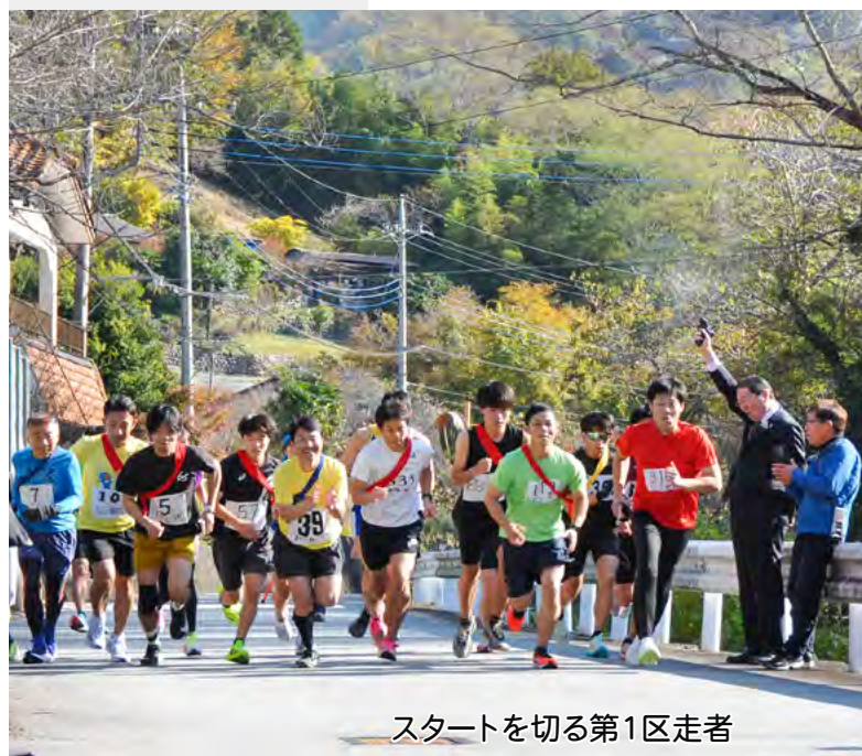
スタートを切る第1区走者

親子の絆深めるスノードーム作り 11/8 山梨県社会教育振興会の体験交流事業として、山梨県婦人福祉会館は高田地区公民館で親子工作教室を開催しました。当日は町内婦人会も運営を手伝い、約40名の親子が参加。台紙に海の生物のシールを貼り水族館のようなスノードームを完成させると、『わぁ、きれーい!』と楽しそうに会話を弾ませていました。