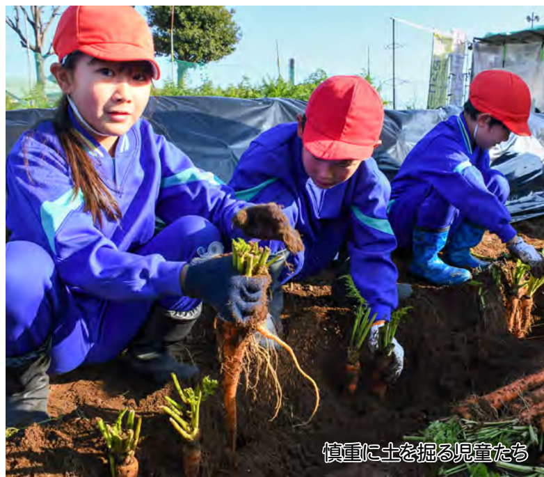
慎重に土を掘る児童たち