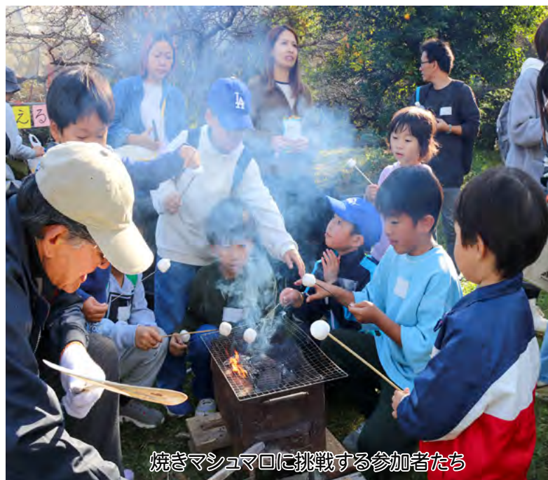
焼きマシュマロに挑戦する参加者たち