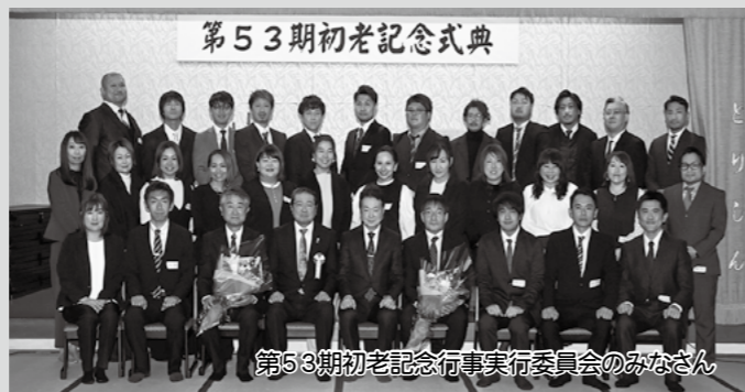
第53期初老記念式典