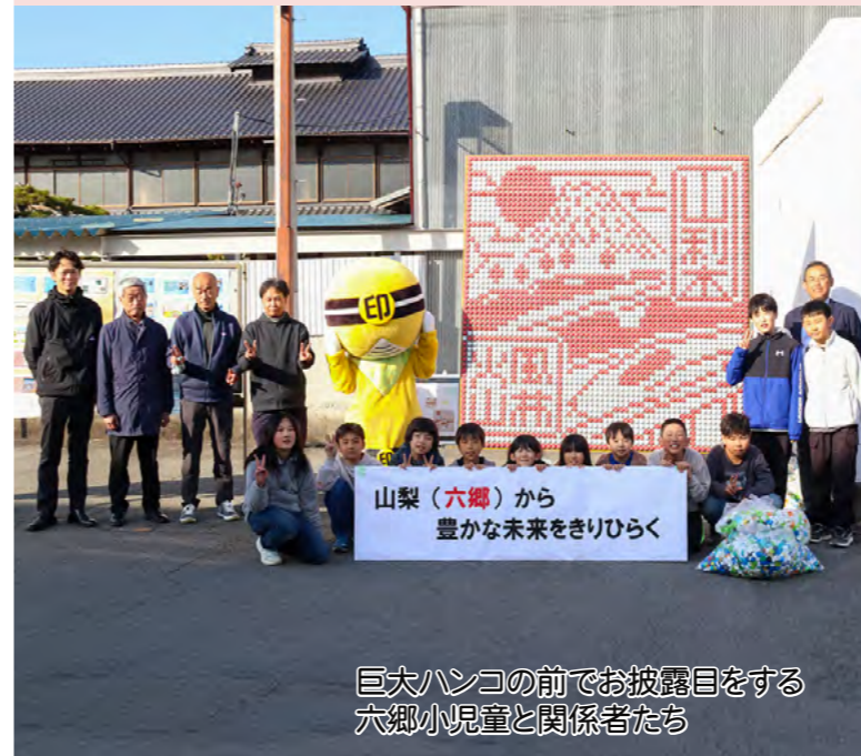
巨大ハンコの前でお披露目をする六郷小児童と関係者たち