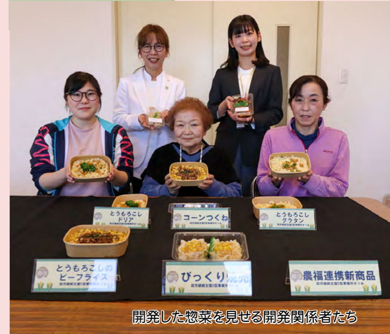
開発した惣菜を見せる開発関係者たち