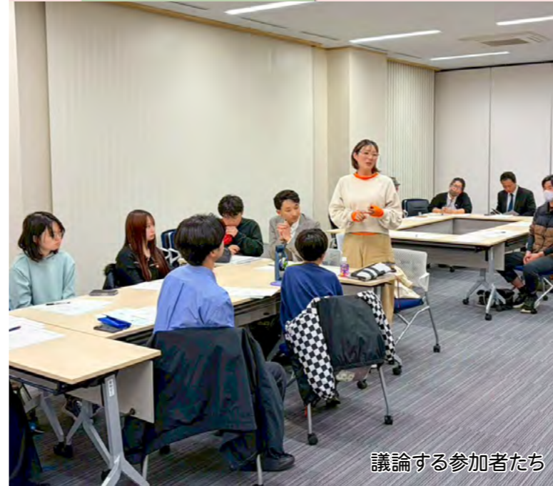
議論する参加者たち