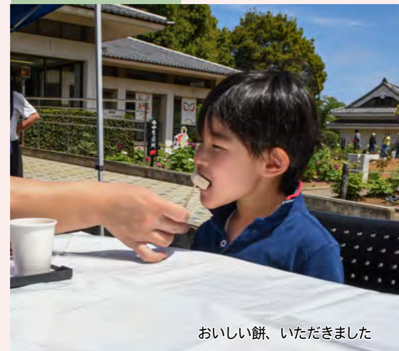
おいしい餅、いただきました

第29回ぼたんの花まつり 4/19 歌舞伎文化公園で、「第29回ぼたんの花まつり」が開催されました。新食感スイーツ「十八番餅(仮称)」のお披露目やヴァンフォーレ甲府の選手によるサイン会が行われたほか、地元のキッズチームによるダンスステージなどで大いに盛り上がりました。