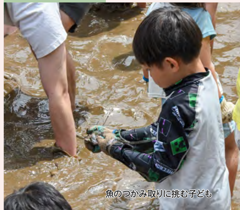
魚のつかみ取りに挑む子ども

親子さかなのつかみ取り大会 5/3 黒沢地区の新川で行われた「親子さかなのつかみ取り大会」には、多くの子どもたちが参加しました。びしょ濡れになりながら川に放たれたニジマスを捕まえた子どもたちは、歓声をあげながらはじける笑顔を見せていました。