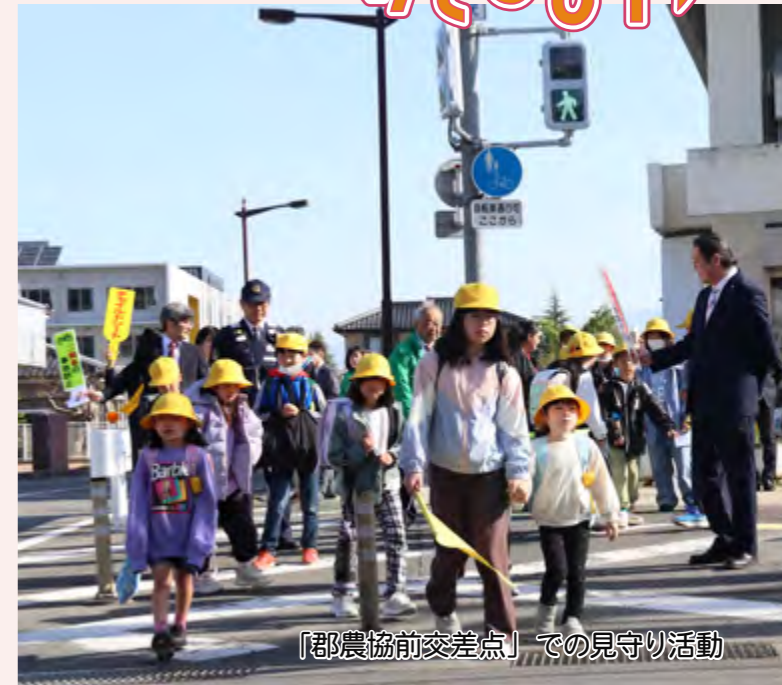
「郡農協前交差点」での見守り活動

第29回ぼたんの花まつり 4/19 歌舞伎文化公園で、「第29回ぼたんの花まつり」が開催されました。新食感スイーツ「十八番餅(仮称)」のお披露目やヴァンフォーレ甲府の選手によるサイン会が行われたほか、地元のキッズチームによるダンスステージなどで大いに盛り上がりました。