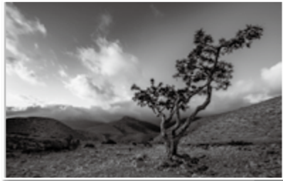
▲乳香の土地 ドファール地方

「フランキンセンス」は、オマーンで最も有名な自然の宝であり、世界でも非常に貴重な香料のひとつとして知られています。フランキンセンスとは、木の樹皮に軽く切り込みを入れた時ににじみ出てくる液体が、小さな水晶状に固まった芳香な樹脂のこと。特にオマーン南部ドファール地方で生産された最高品質のものは、何千年の間高級品として扱われ、金よりも高価な時代があったほどです。