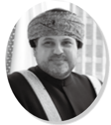
モハメッド・アル・ブサイディ 駐日オマーン・スルタン国特命全権大使