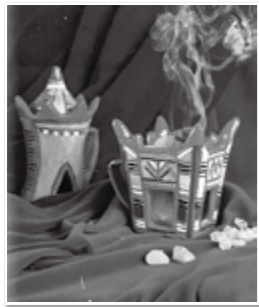
▲フランキンセンスのお香

お香を焚くように火をつけると上品な香りが漂い、オマーンでは来客を迎える時のおもてなしとして家庭で使われていました。香り以外にも、ボスウェル酸と呼ばれる天然化合物が含まれており、体の炎症を抑える、免疫力をつける、解毒作用などの効果があります。