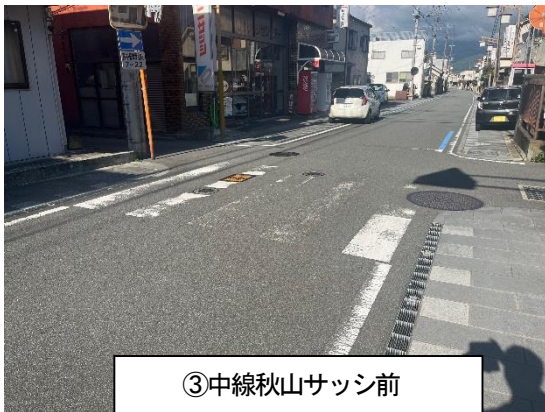
③中線秋山サッシ前