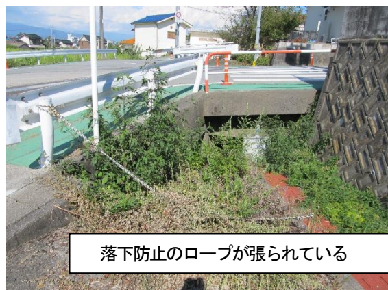
落下防止のロープが張られている