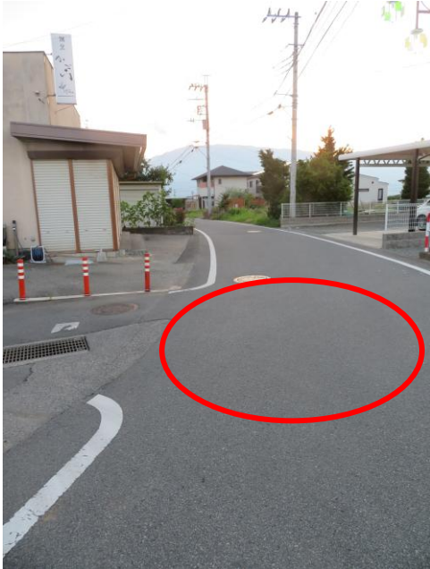
写真① 見通しの悪いカーブや交差点・スピード超過 割烹かさい前の見通しの悪い道路