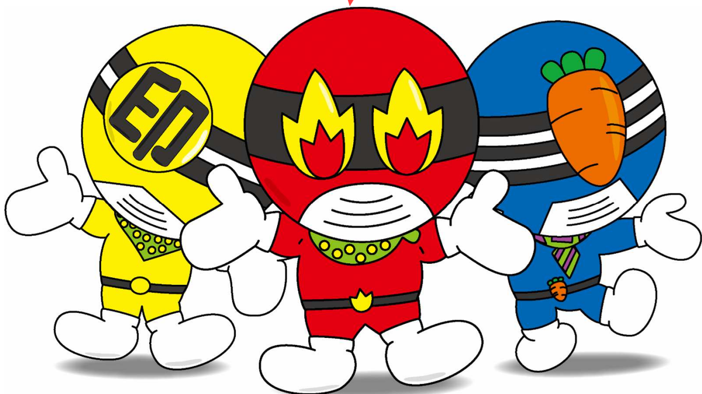
市川三郷町PRキャラクター 市川三郷レンジャー