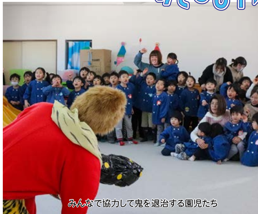
みんなで協力して鬼を退治する園児たち

みんなで学ぶ 三世代交通安全教室 12/19 園児、父母、祖父母の三世代を対象に、家庭での交通安全意識の向上を目的とした交通安全教室が町生涯学習センターで行われました。鯉沢警察署、JAF、交通安全母の会の協力のもと、モニターでの交通体験や模擬道路の通行を通じ、交通安全を学びました。