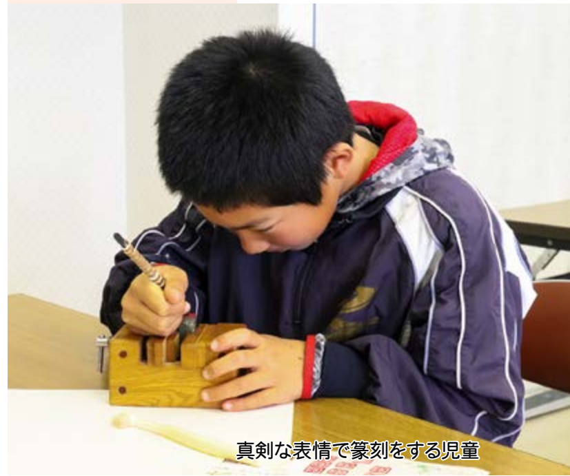
真剣な表情で篆刻をする児童