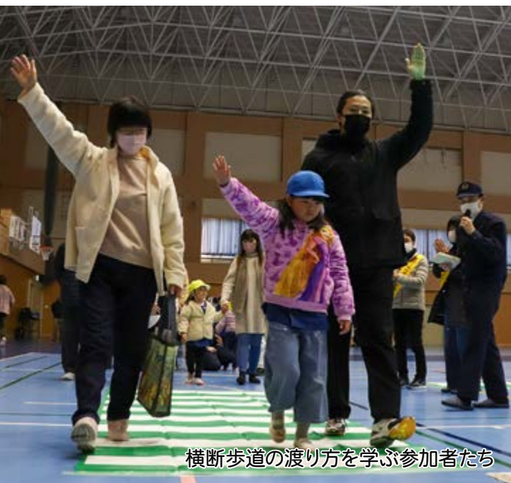
横断歩道の渡り方を学ぶ参加者たち