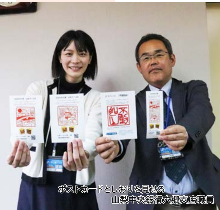
ポストカードとしおりを見せる 山梨中央銀行六郷支店職員

想いを込めたはんこ六郷小卒業制作 2/5 六郷小では毎年卒業制作として、各自の名前のはんこ（篆刻）を制作しています。今年も6年生13人が六郷印章業連合組合の指導のもと、細かい作業に苦戦しながらも想いを込めて取り組み、自分だけの手づくりはんこを完成させることができました。