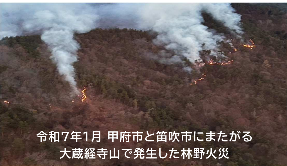
令和7年1月 甲府市と笛吹市にまたがる 大蔵経寺山で発生した林野火災